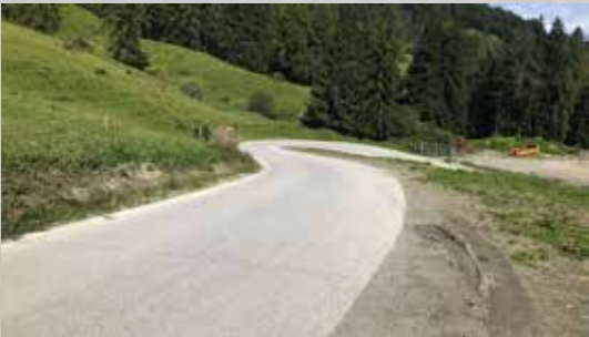
Güterstrasse, Oberfläche gefräst