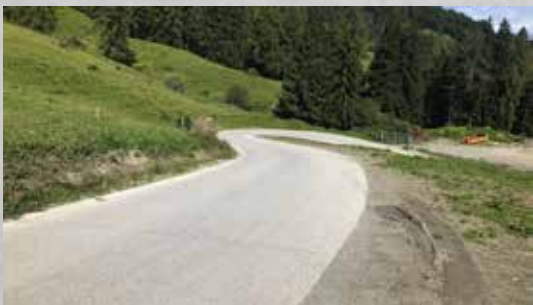
Güterstrasse, Oberfläche gefräst