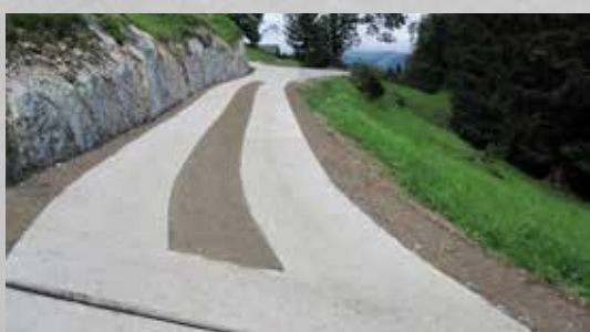
Spurwege, Oberfläche Besenstrich und geprägt

Ausführung als Fahrspuren oder Fahrbahn möglich. Im Güterweggebau für Forst und Landwirtschaft.